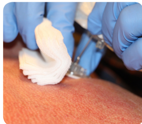
10. Naald verwijderen CAVE: veiligheidssysteem van de naald correct gebruiken