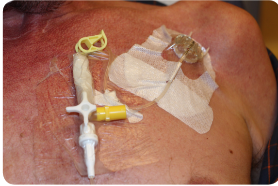
2. Verband + PAC naald