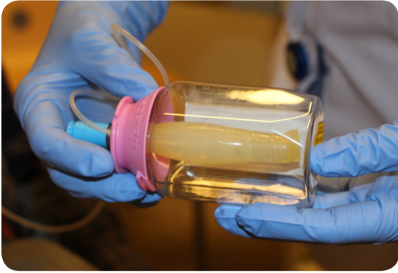
1. Folfusorpomp is leeg