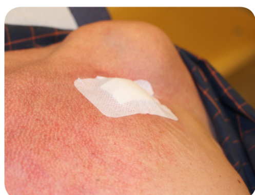
13. Eindverband aanbrengen