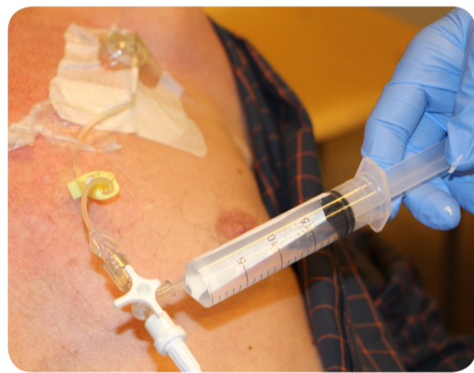
5. Spuit met 20ml NaCl 0.9% op driewegkraan plaatsen