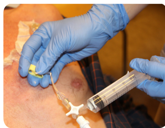
7. Spoel de PAC met 20ml NaCl 0.9% (pulserend inspuiten en afsluiten onder positieve druk)