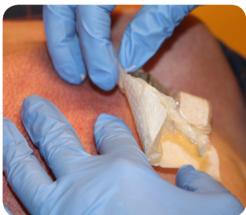
9. Verband t.h.v. PAC naald verwijderen