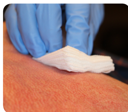
11. Aanprikplaats afdrukken met compres