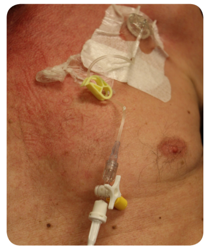
4. Papier tape (Micro-pore) rond driewegkraan verwijderen