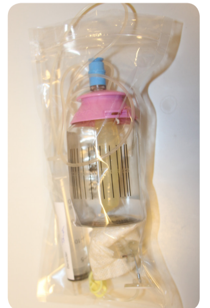
12. Folfusorpomp + naald (gesloten systeem) in bijhorend zakje plaatsen.