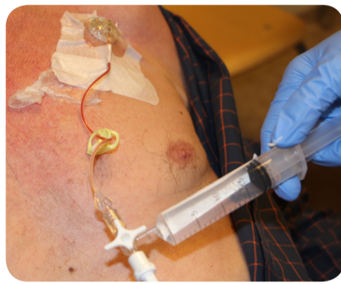
6. Aspireer hiermee voor controle reflux